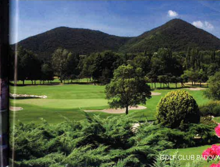
GOLF CLUB PADOVA