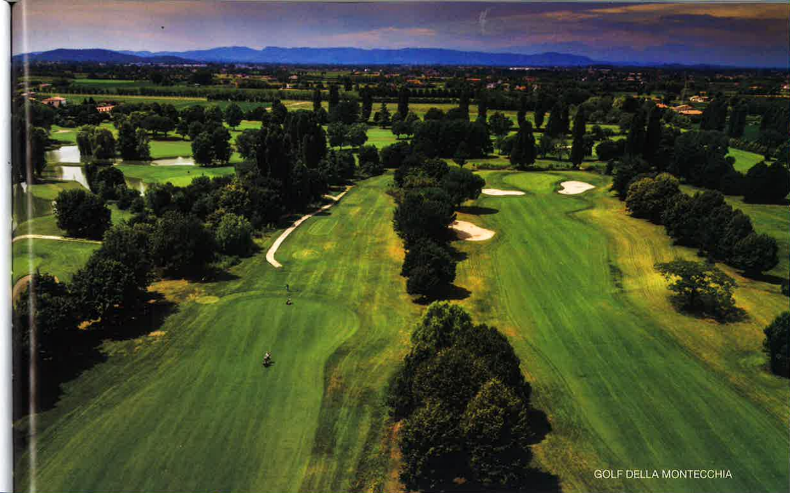
GOLF DELLA MONTECCHIA

H heute wie vor zweitausend Jahren zählen die Thermen von Abano, Montegrotto sowie Galzignano Terme zu den größten Heil- und Thermalzentren Europas. Eingebettet in das samtige Grün der Euganeischen Hügel, nur einen Steinwurf südlich von Padua, bieten sie die ideale Basis für Entspannung, Heilung und körperliches Wohlbefinden. Das warme Thermalwasser kommt aus den unberührten Becken der Lessinischen Berge in den Voralpen und fließt unterirdisch in einer Tiefe von 2.000 bis 3.000 m durch Kalkstein. Angereichert mit Mineralsalzen kommt es dann in die Thermen und macht zusammen mit dem Heilschlamm diese Kurorte so berühmt. Wegen der wohltuenden Wirkung war die Region jeher schon ein beliebter Erholungsort. Jahrhunderte nach den Römern waren es unter anderem Musiker, Literaten, Denker und Dichter wie Mozart, Goethe und Shakespeare, die sich in den Quellen erholten. Die Anwendungen reichen heute von der Badetherapie,