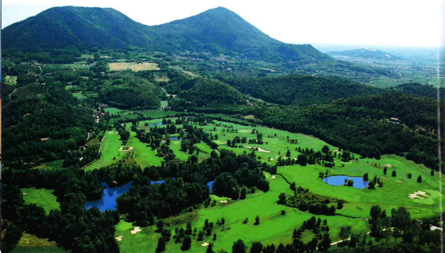
GOLF CLUB FRASSANELLE