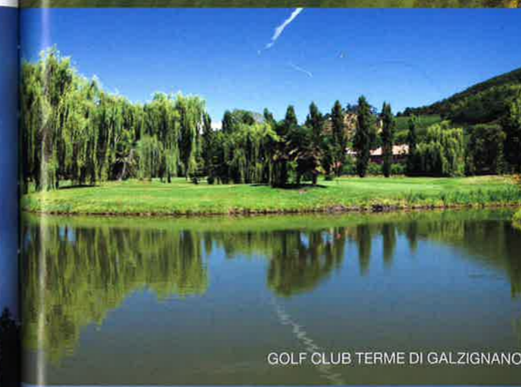
GOLF CLUB TERME DI GALZIGNANO