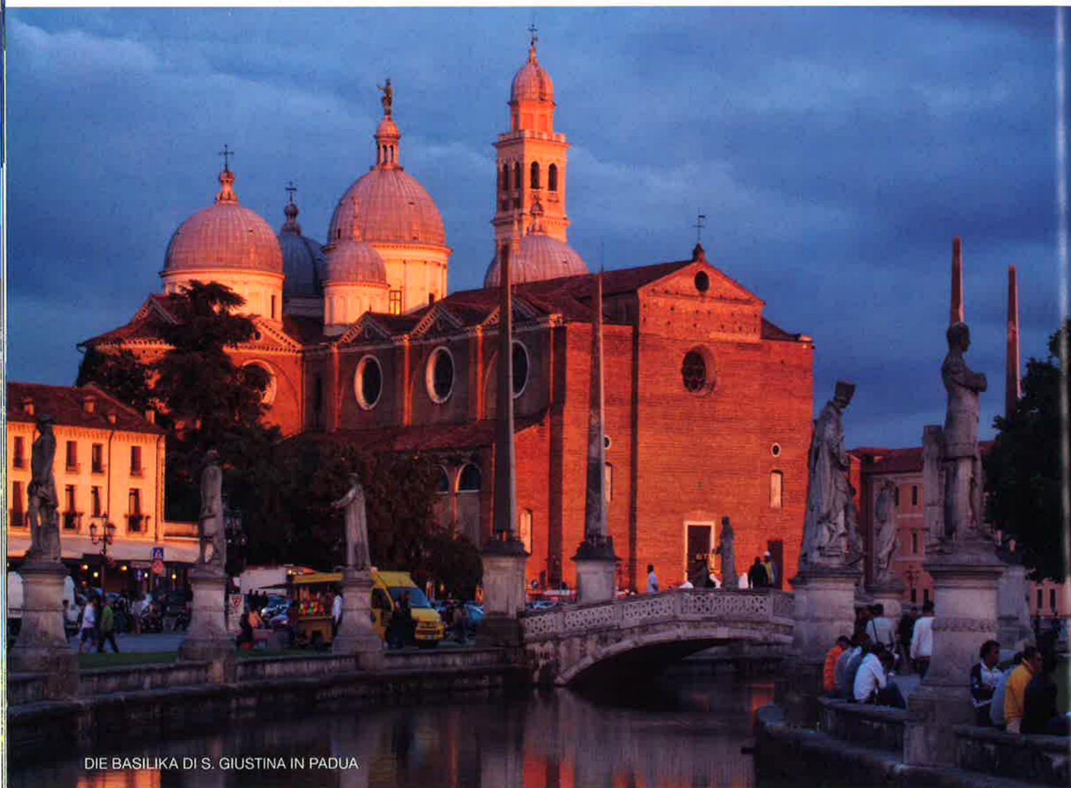
DIE BASILIKA DI S. GIUSTINA IN PADUA