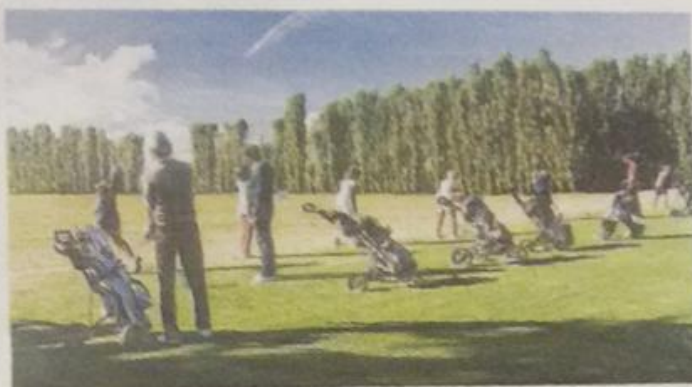
Il golf è uno sport praticato ormai da tutte le generazioni